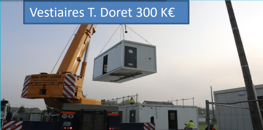
Vestiaires T. Doret 300 K€