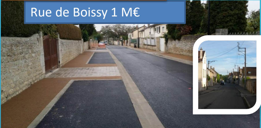
Rue de Boissy 1 M€